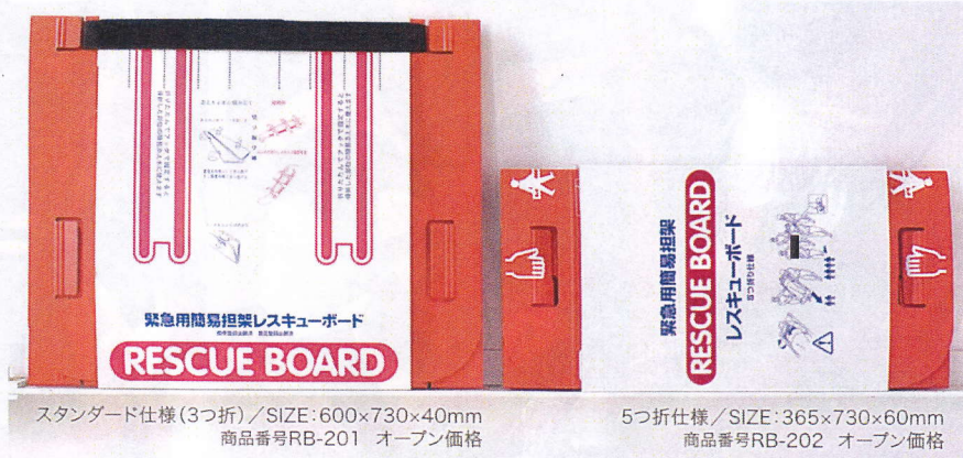
スタンダード仕様(3つ折)/SIZE:600×730×40mm 商品番号RB-201 オープン価格